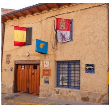
Albergue San Miguel

Villares de Órbigo (León) Tfno: 987 13 29 35