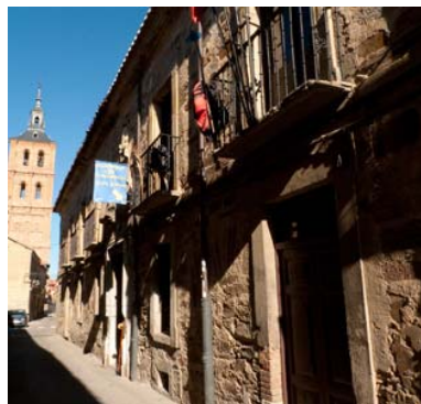
Albergue de Peregrinos San Javier