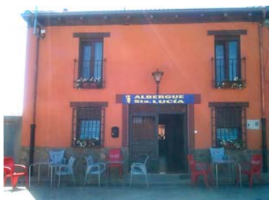
Albergue Santa Lucía