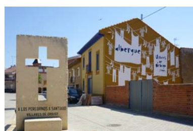
Albergue turístico de Villares de Órbigo

Hospital de Órbigo (León) Tfno: 987 38 84 44, 661 994 238