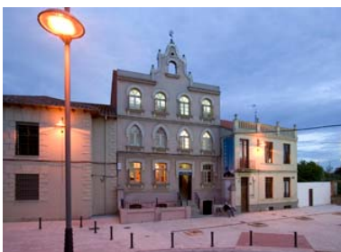
Albergue de peregrinos Siervas de María