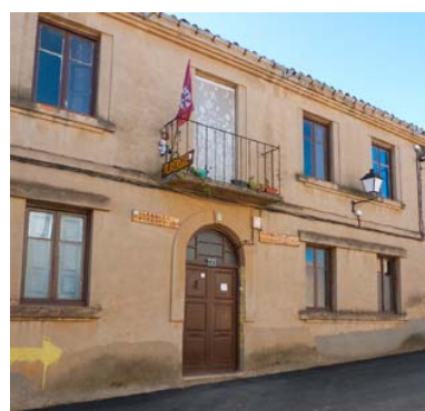
Albergue Parroquial Santibáñez Valdeiglesias

Hospital de Órbigo (León) Tfno: 987 388 285, 609 420 931