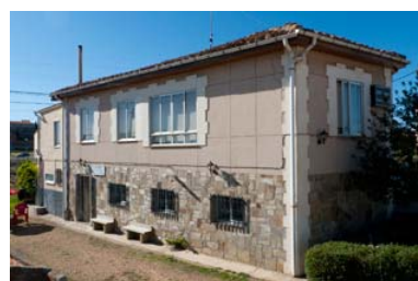
Albergue Camino y Vía

Santibáñez de Valdeiglesias (León) Tfno: 626 362 159