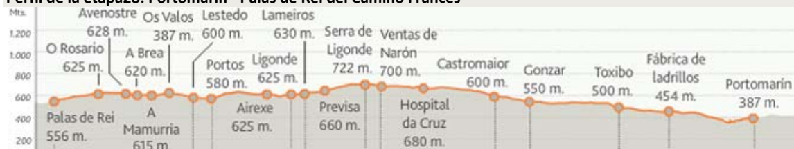
Perfil de la etapa28: Portomarín - Palas de Rei del Camino Francés

La historia de Palas de Rei se remonta a épocas remotas, y más teniendo en cuenta la cantidad de castros celtas existentes en su término municipal y su emplazamiento en la vía romana Lugo-Astorga. Era un lugar importante en la Edad Media donde solían juntarse los peregrinos para afrontar los últimos tramos de la ruta jacobea. La iglesia de San Tirso , más en concreto, su portada románica, es el único vestigio que queda de su pasado histórico. Sin embargo la riqueza artística de su Concello es considerable: una veintena de iglesias románicas como la de Vilar de Donas, el castillo de Pambre y el literario y televisivo Pazo de Ulloa . Palas de Rei cuenta con múltiples posibilidades de aprovisionamiento y de disfrute para el peregrino.